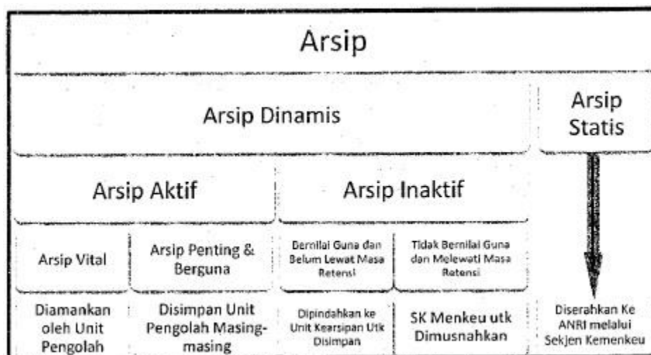
Gambar 2 Jenis-Jenis Arsip

Klasifikasi arsip berkaitan dengan bidang tugas di lingkungan Direktorat Jenderal Pajak terbagi menjadi dua bagian yaitu :